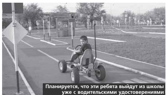
Планируется, что эти ребята выйдут из школы уже с водительскими удостоверениями