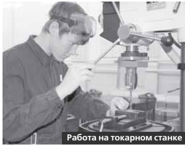
Работа на токарном станке

Это учебное заведение дает профобразование базового и повышенного уровня. По образовательному и профессиональному статусу стоит выше техникума. Формы обучения в нем — очная, очно-заочная. Учредитель — Министерство труда, занятости и социальной защиты.