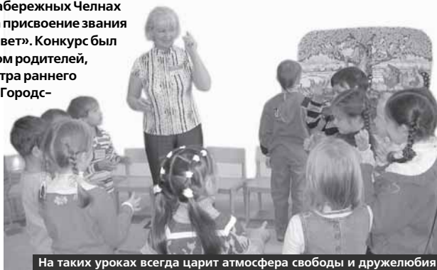
На таких уроках всегда царит атмосфера свободы и дружелюбия

Уже несколько лет в Набережных Челнах проводится конкурс на присвоение звания «Учитель, дарующий свет». Конкурс был учрежден содружеством родителей, детей и педагогов Центра раннего развития «Светлячок» Городского дворца творчества детей и молодежи. Это звание было присвоено уже 16 педагогам.