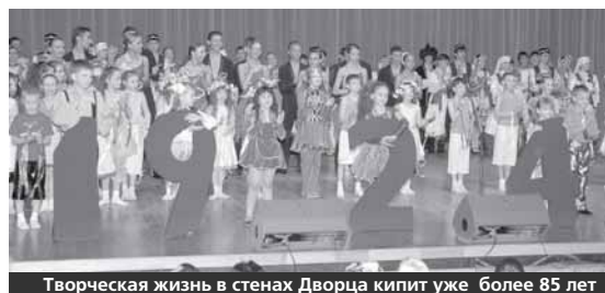
Творческая жизнь в стенах Дворца кипит уже более 85 лет

«Городской дворец творчества детей и молодежи» является определенным брендом, который гарантирует высокое качество образования, увлекательный досуг и интересное общение.