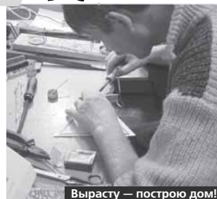
Вырасту — построю дом!